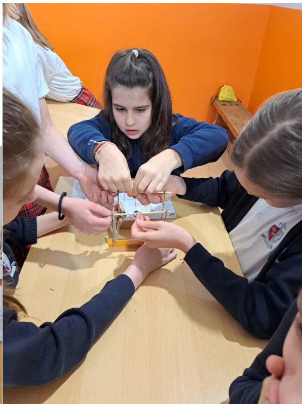
Radionice Parka znanosti - Dan znanosti