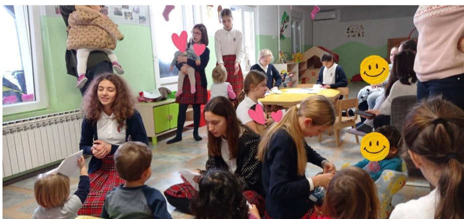
Posjet Caritasovoj kući ljubavi