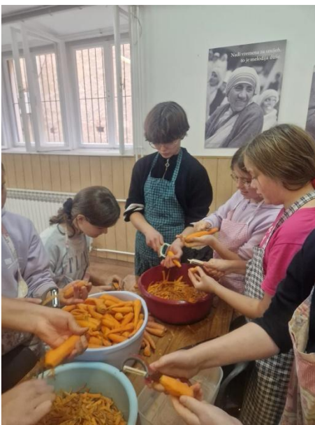
Tko je moj bližnji?