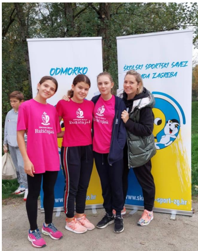
Natjecanje u atletici