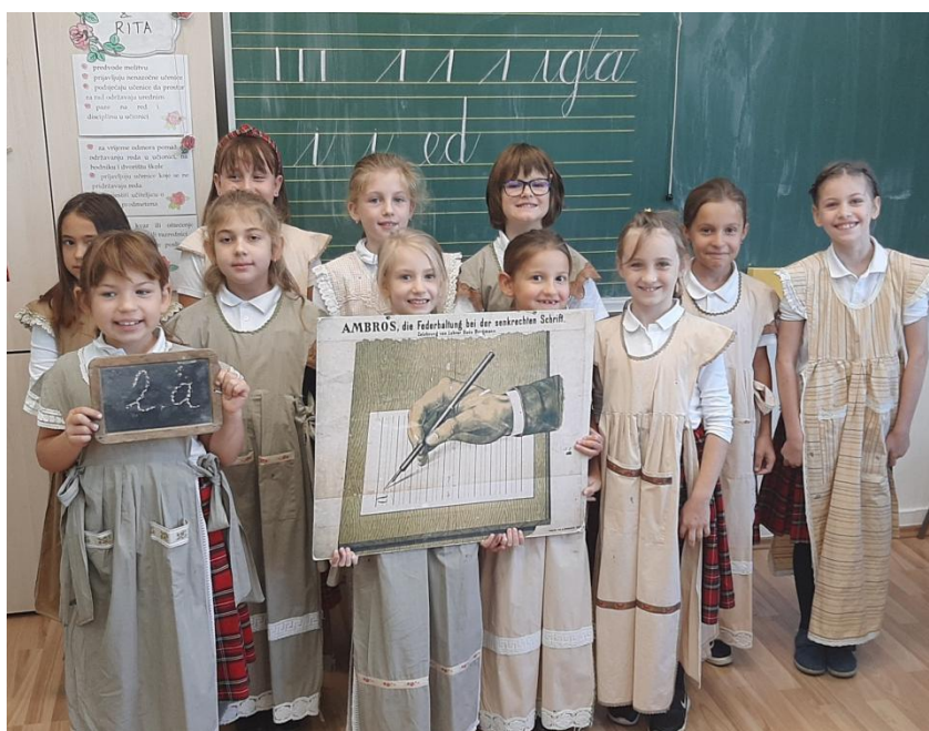
Radionica kaligrafije - Školski muzej

Projekt MENTORSTVO kojemu je osnovni princip program osobnog razvoja nastojao je omogućiti svakoj učenici razvoj karaktera i osobnosti te rast u vrlinama. Svaka je učenica imala priliku iskoristiti svoje snage i talente u raznim područjima i