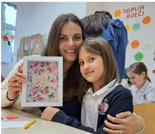
Druženje majka i kćeri - Majčin dan