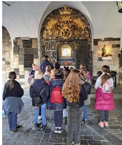
Obilazak grada Zagreba