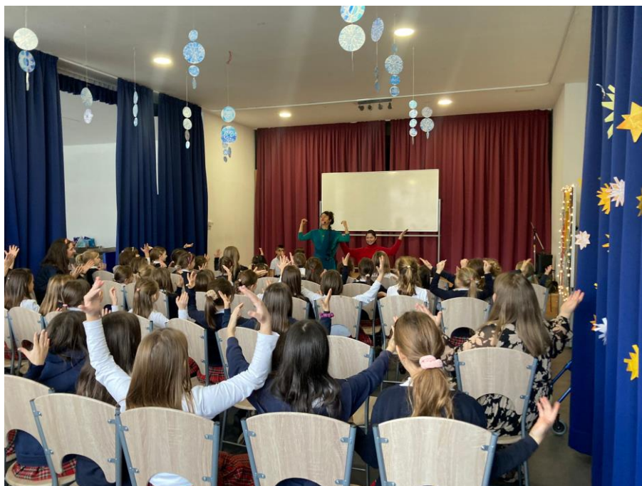
Susret s književnicom