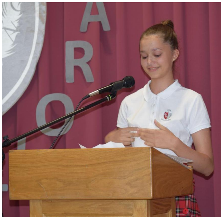
Govor učenice generacije na svečanoj podjeli svjedodžbi