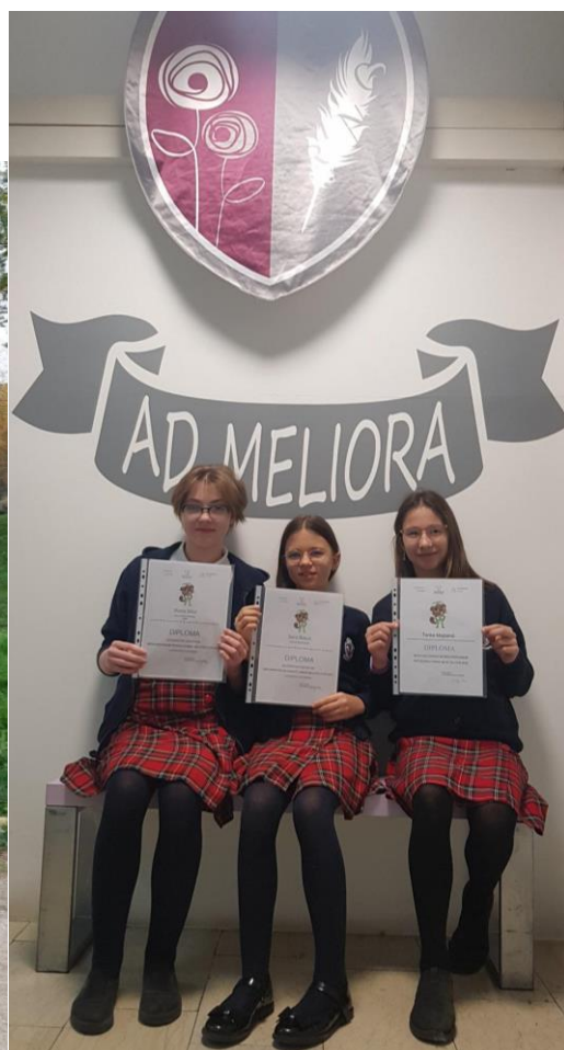
Nagrađene učenice - natječaja Dabar