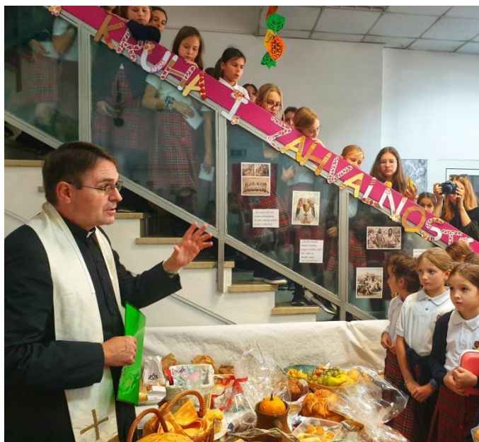
Dan kruha i zahvalnosti za plodove zemlje